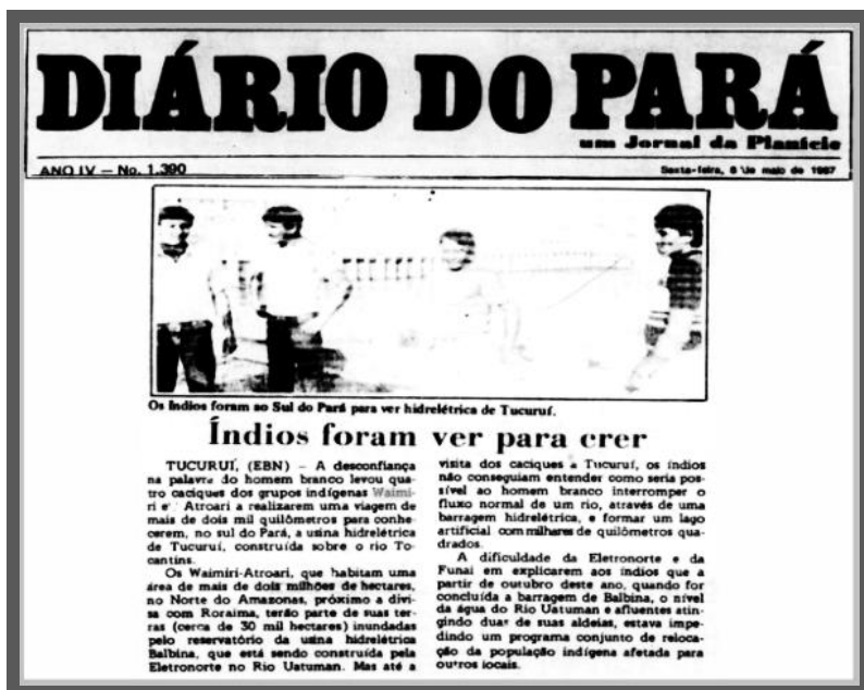
Imagem 50 - Diário do Pará, nº 1.390, 08.05.1987